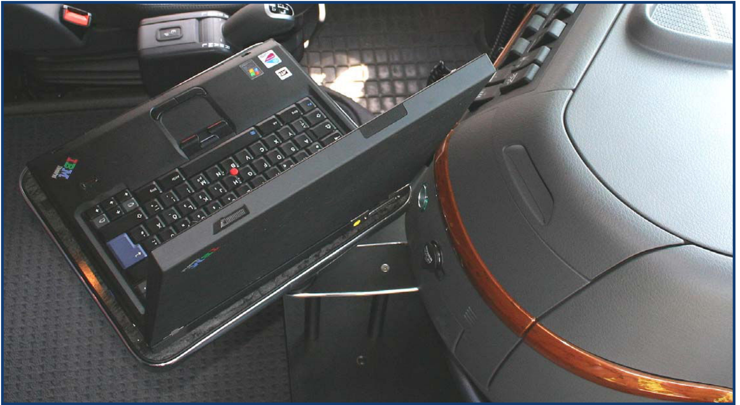
Freie Sicht auf die Straße. Robuster Halt. Ergonomische & sichere Bedienbarkeit