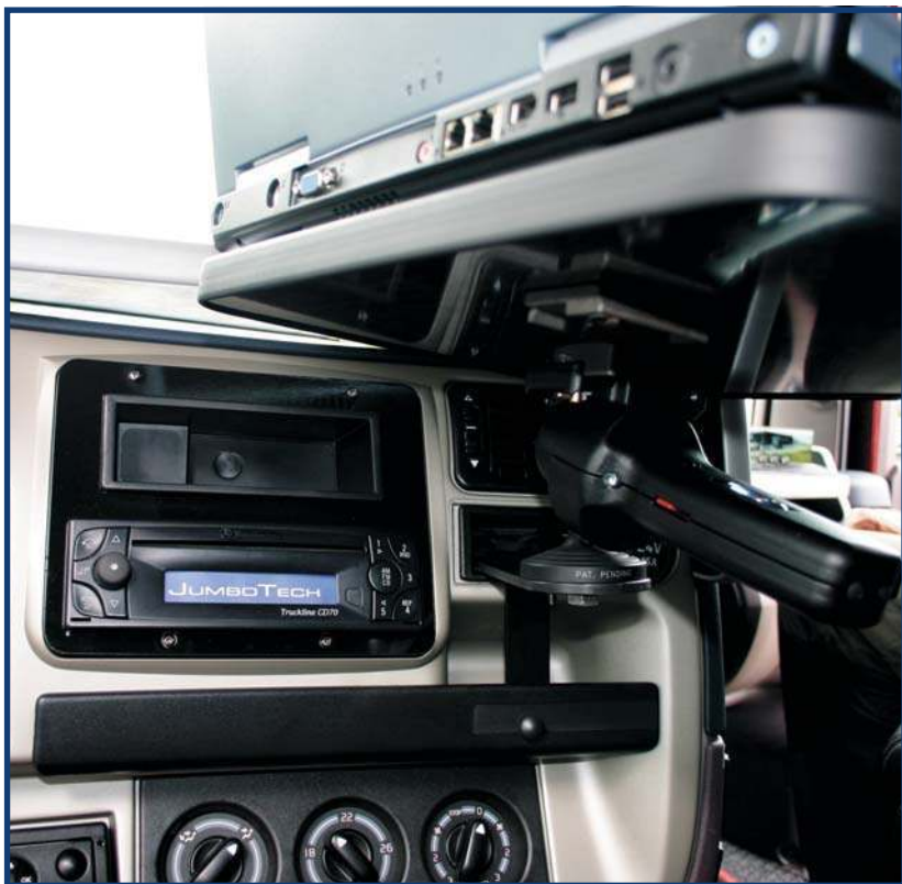
Nicht einfach nur ein Halter. Sie erhalten ein System für Profis.