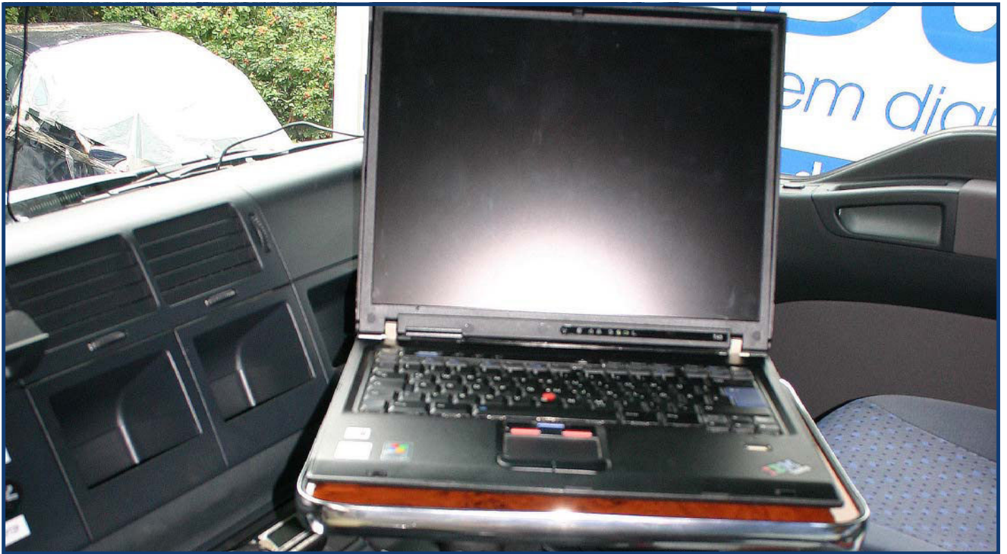
Freie Sicht auf die Straße. Robuster Halt. Ergonomische & sichere Bedienbarkeit