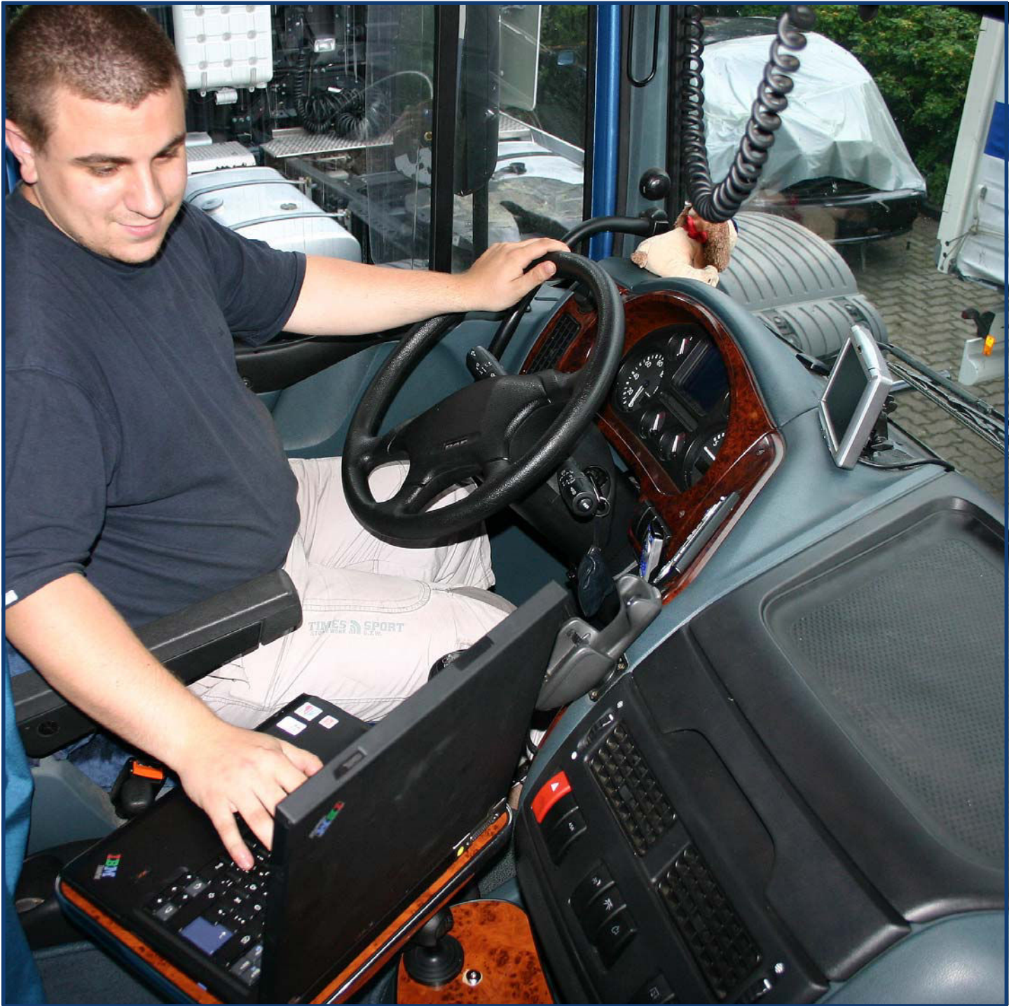
Notebookhalter für den DAF XF 105 & 95