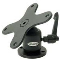
604010 Joiner Medium Short