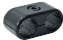
601082 Joiner Parallel Mount 25 mm