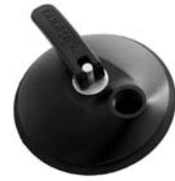
601100 Joiner Quicker