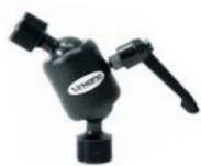
601010 Joiner Small