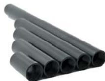
601051 50 mm, 601052 100 mm, 601053 150 mm, 601056 200 mm, 601054 300 mm Joiner Sleeve