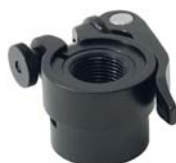
602081 Joiner Quick Release no plate