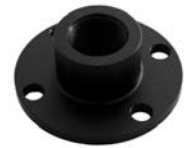
601060 Joiner Round Plate 30x38