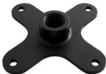
601040 Joiner VESA 75