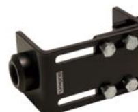
602100 Joiner Beam Mount