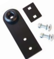
208000 Chair Rail Mount