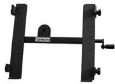
501100 Hold Large