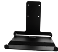
503000 Screen Keyboardplate