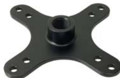
601042 Joiner VESA 75/100