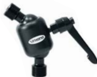
601020 Joiner Medium