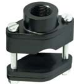
601085 Joiner Sleeve Mount 15-30 mm