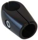
601080 Joiner Sleeve Mount 25 mm