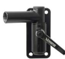
401713 Wall Mount