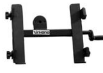
501200 Hold Small