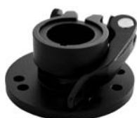
602080 Joiner Quick Release