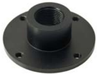
601065 Joiner Round Plate 38x38