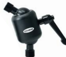
601030 Joiner Large