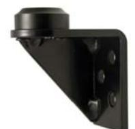
602110 Joiner Universal Mount